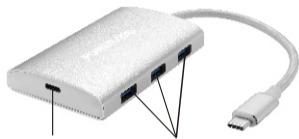
Port de charge Type C